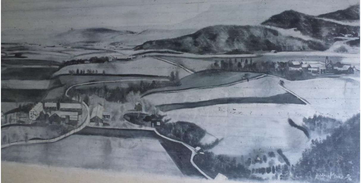
En del av maleriet som viser Mæle og Bye