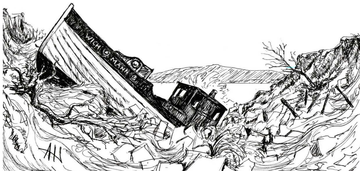
Båten "Wichmann" ble tatt av raset i 1947