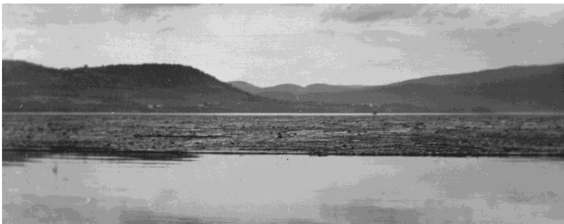
Ei "klæsje" kunne av og til inneholde ca. 100 000 tømmerstokker

Ingebrigt kunne klare seg med lite søvn, noe som var en forutsetning for å drive som han gjorde. En sommer holdt han det gående i 14 dager 24 timer i døgnet. Det var sanking rundt sjøen på dagen sammen med fløtingsmannskapet. Nettene måtte han bruke til å slepe tømmer til sagbrukene. 500 timer sammenhengende på båten med minimalt med søvn. Var bare innom hjemmekaia på Fuglem og fylte solar og fikk matforsyninger brakt på kaia.