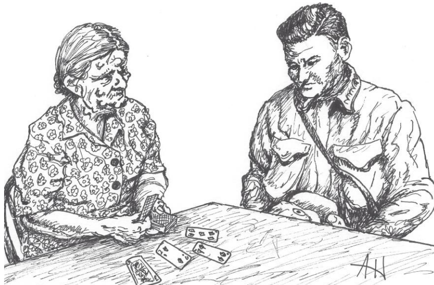
Spåkjerringa i aksjon