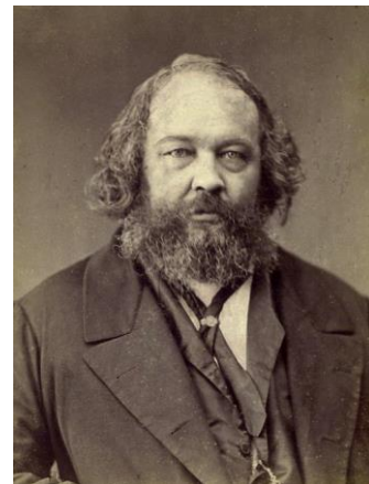
Mikhail A. Bakunin

Mikhail Aleksandrovitsj Bakunin (1814-1876) var en russisk forfatter, revolusjonær og agitator, en av anarkismens forgrunnsfigurer. Det var han som oversatte Karl Marx' verk Das Kapital til russisk. Han vokste opp i en russisk godseierfamilie, og fikk som normalt i disse kretser, utdanning ved en militær skole og ble offiser. I 1847 ble han utvist fra Russland på grunn av hans forhold til tsaren. Han omsatte raskt opprør i teori til opprør i praksis og deltok i oppstandene i Paris, Praha og Dresden. Oppstanden i Dresden gjorde at han ble arrestert i 1850 og dømt til døden i Sachsen, men ble utlevert til tsaren. I Russland satt han i fengsel inntil han i 1857 ble deportert til Sibir. Herfra flyktet han i 1861 og