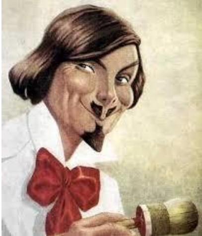
«Maleren på spannet»