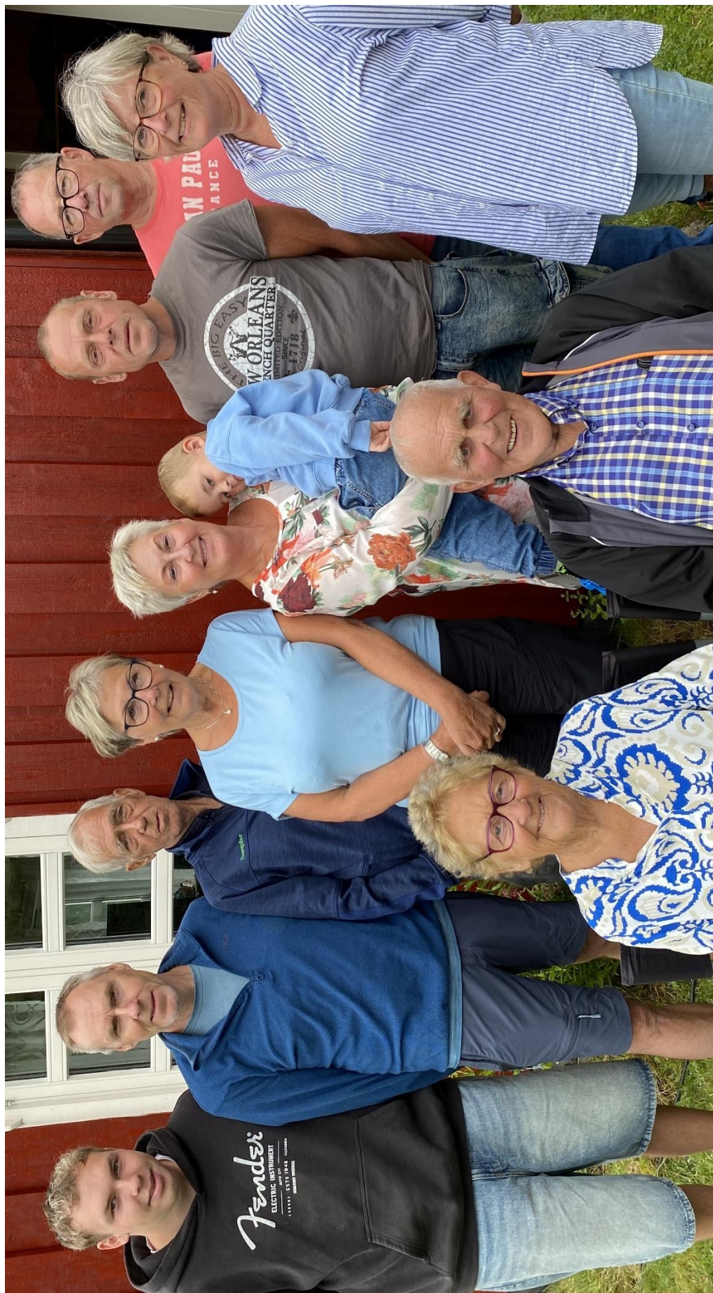
Bildet tatt på Dalberg lørdag 26. juli 2025. Familiemedlemmer med tilknytning plassen.