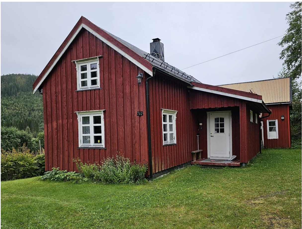
Huset fra Rauåkløfta, slik det står på Dalberg i 2025