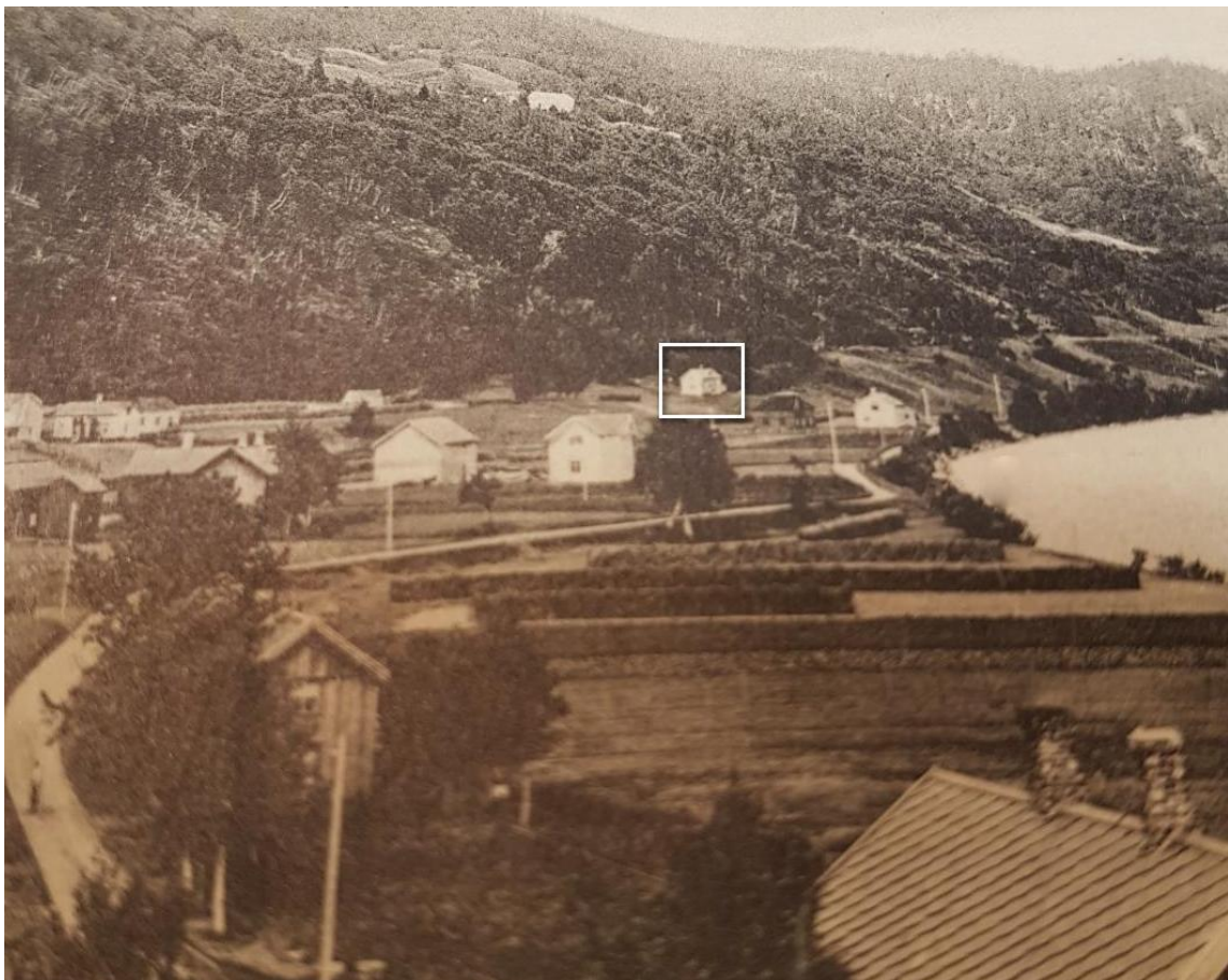
Huset da det stod i Grønsetgrenda