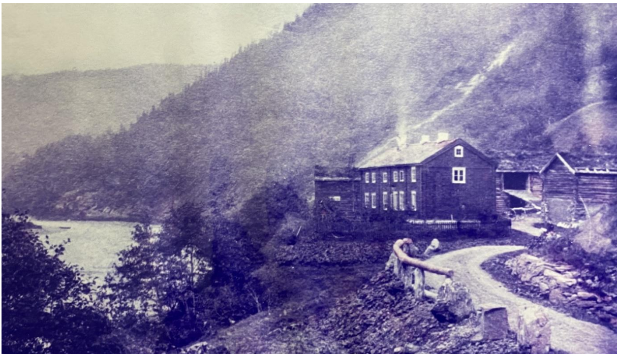
Stageberg i gamle dager

kunne følge toppen av åskammene om sommeren, mens en brukte kanskje elveisen nede i dalen om vinteren. Det var et samvirke mellom folkene øverst i Forradalen og Stjørdalen, som bandt for eksempel sammen folk fra Østerås med folk fra Stageberg og Bonsletta vv. Folk fra lengere nede i Forradalen hadde tilsvarende forhold til f. eks Markabygda. Og «kjærligheten» vandret på kryss og tvers og hadde ingen grenser. Ekteskapet var livsforsikringen. Ble en ikke gift, var fremtiden temmelig usikker, en ble lett gående som taus eller dreng på en storgård resten av livet. Ja, i en tidsperiode gikk fedrene opp-ned kirkegulvet og bød frem sine døtre, mest som et fesjå. Vedrørende enkelte storgårder i hoveddalene, var det nok mer vanlig enn vi liker å snakke om, hva gjelder avtalte ekteskap. Når jeg var liten, ble det snakket om at den ene storgården giftet seg inn i den andre. Ja, det ble sagt med en viss undertone at hun hadde fått sin utvalgte allerede i dåpsgave. Og der det kanskje ikke var kjærlighet, ble det sagt følgende fra svigermor, som muligens selv hadde den erfaringen: « kjærligheten får komme etterpå ». Vårt par innledningsvis her, var nok ganske så vanlig, og dette kapitlet skal gi eksempler fra nettopp dette geografiske området, hvor slektsbånd lå til de nærmeste gårdene.