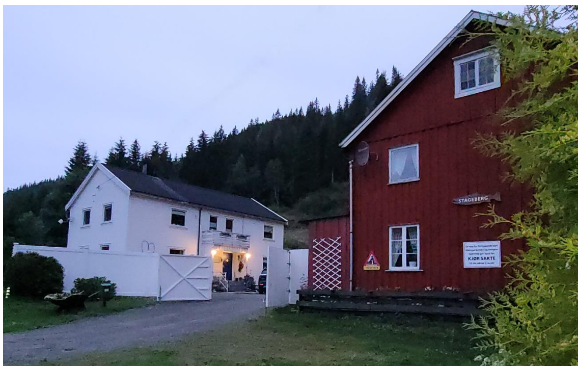
Stageberg 2024