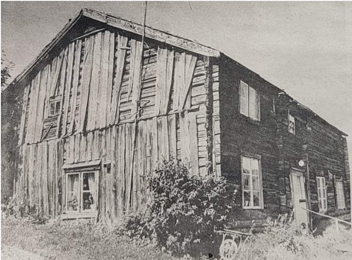
Huset på Østerås øvre fra 1638, som falt sammen først på 2000-tallet