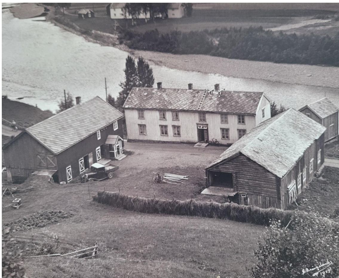
Stageberg 1954. I bakgrunnen Mølsknes