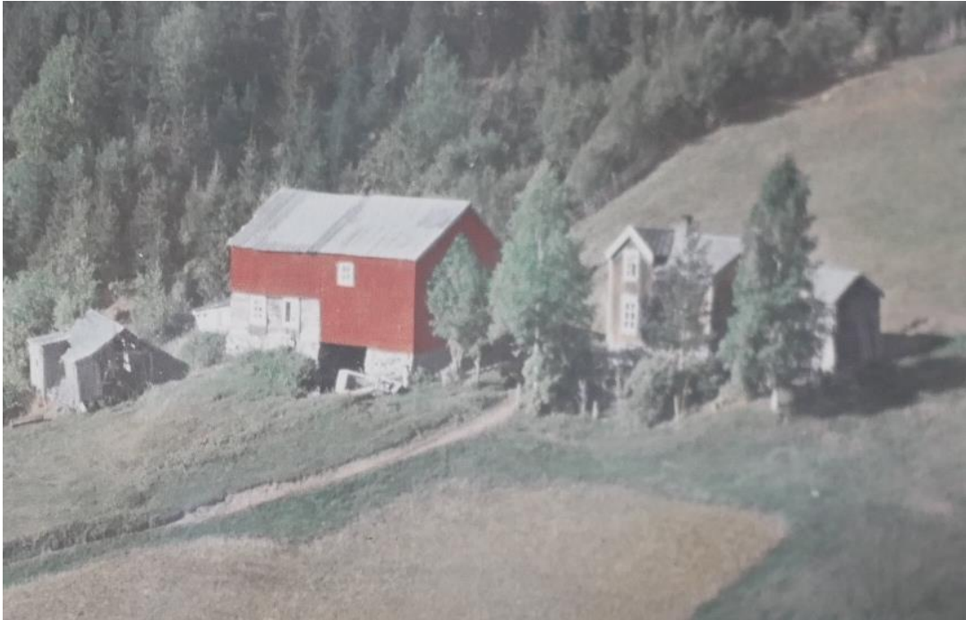
Bonsletten øvre. I dag er det kun noen murer igjen