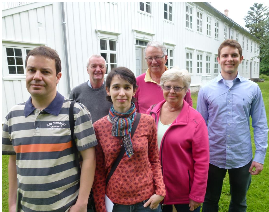
På Værnes Hovedgård, 28. juni 2013