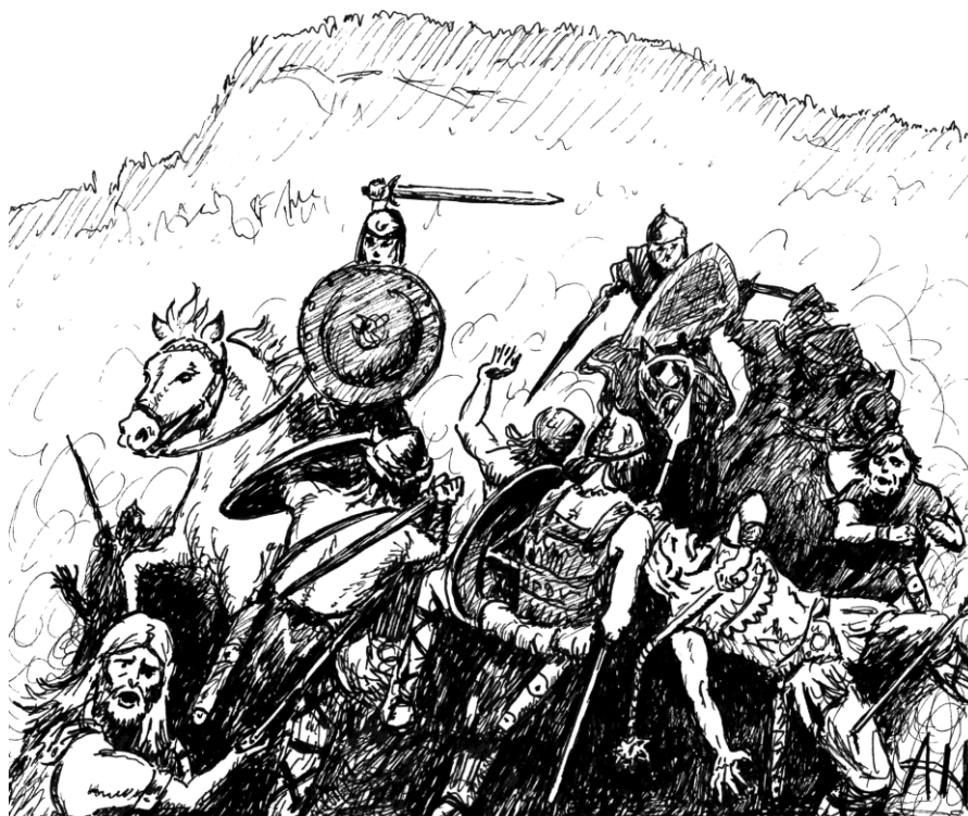
Det stod trolig et slag rundt Kongshaugan og Haraldreina