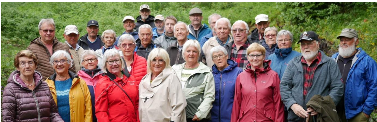
Flaksjøen, lørdag 1. juli 2023

Hva sitter en kanskje igjen med, utenom den store beundringen for selve prestasjonen å klare seg i Flaksjøliin? Trolig er det en konstatering av at det måtte være gode gen i de to familiene. Slitesterke, og arbeidsomme, men fremfor alt friske. Alle «overlevde», og alle fikk et hjem - et hjem er nå engang et hjem uansett, og et anker for sin egen frihet. Og trangen til frihet er en enorm drivkraft. Kanskje nettopp derfor klarte de seg der inne i ødemarken - noe for seg selv: friheten.