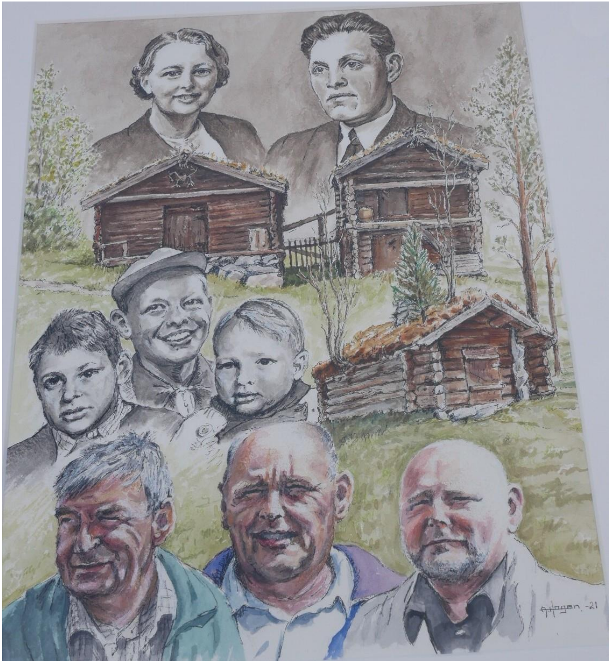
Eksempel på slektstegning