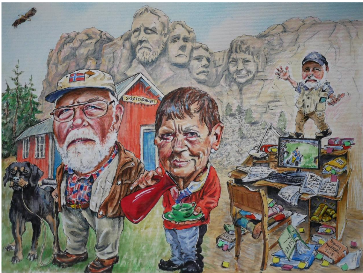
Eksempel på karikaturtegnning