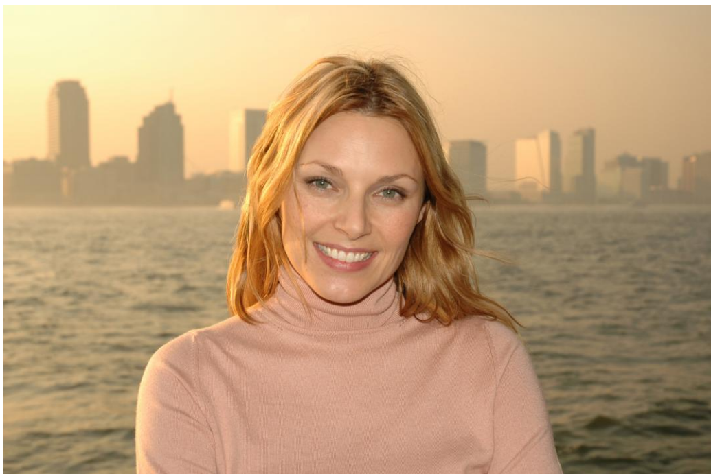
Mona Grudt slik vi ser henne i dag

Mona Grudt stråler mot oss i mange sammenhenger som modell innen reklamebransjen. Hun er så vanlig, gjør det de fleste mødre gjør. Kanskje er det derfor vi synes så godt om vår Miss Mona. I dette ligger en kime av erkjennelse om en myte som burde vært avlivet for lenge siden. Nemlig at misser kun er blonde, dumme piker. En del nyfeminister har ikke gjort livet enklere for vakre kvinner, kanskje i lys av misunnelse. De fikk stemplet både skjønnhetskonkurransen og modellyrket ned til mindreverdige og uakseptable, som ødela noe de kalte for "kvinnefrigjøringen". Stadig skrik om kvinneundertrykkelse gikk vel så langt til slutt at det slo andre veien. Jeg erindrer sist på 70-tallet og først på 80-tallet da feministene skulle hive BHene. Så døde også den protesten bort, og vi er i dag tilbake med omtrent 100 % dekning - i dobbelt forstand.