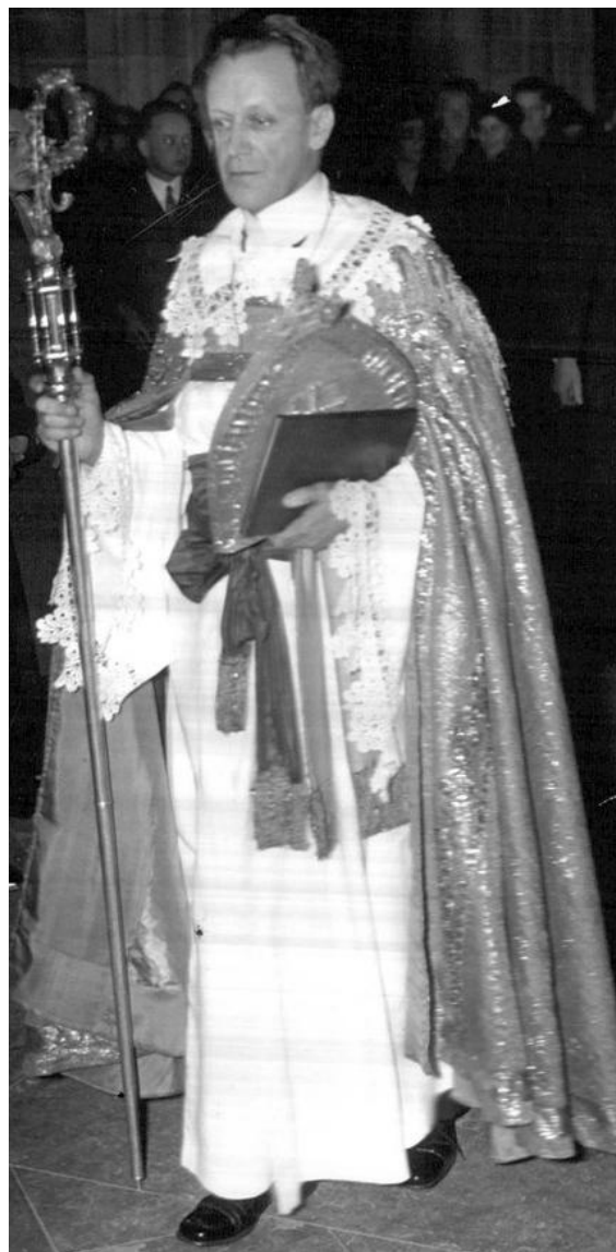
Erkebiskop i Sverige 1932-1950: Erling Eidem

Erling Eidem het opprinnelig Andersson, født 23. april 1880 i Göteborg. Døde 14. april 1972 i Vänersborg i det sørvestlige hjørnet av