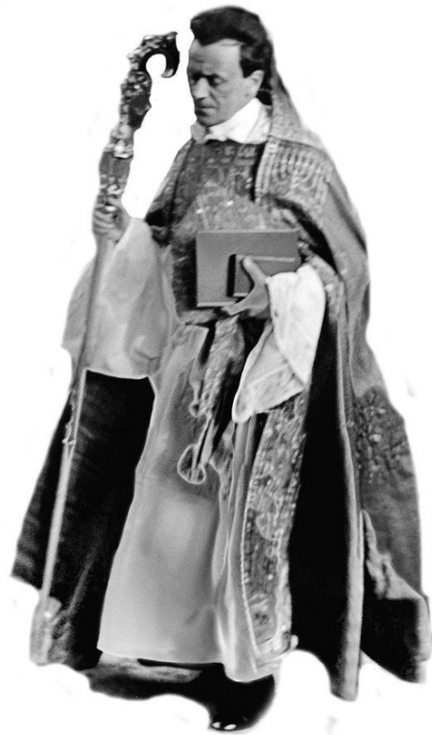
Erkebiskop Erling Eidem

I 1935 forrettet han da den senere kong Frederik 9. giftet seg med prinsesse Ingrid i Storkyrkan. Eidem avsluttet sitt oppdrag i 1950 og ble dermed den første erkebiskop av Uppsala etter reformasjonen som ikke hadde sittet i embedet på livstid. 81 år gammel utførte Erling Eidem den første TV-sendte begravelsen i Sverige, da Dag Hammarskjöld ble gravlagt 29. september 1961 i Uppsala. Eidem gikk dermed direkte ut til store deler av verden.