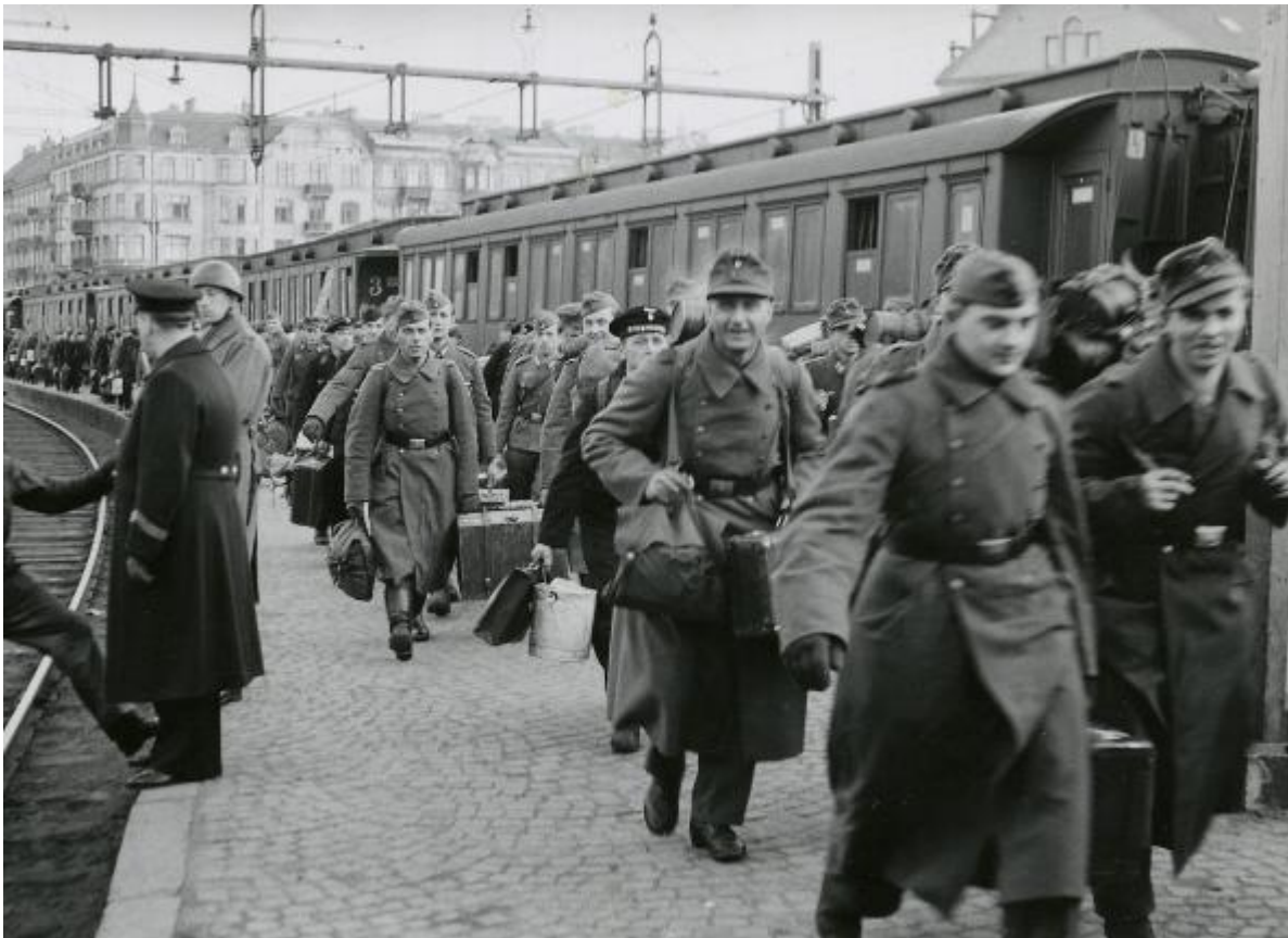
Sverige tillot Tyskland å bruke det svenske jernbanenettet til forflytning av både personell og materiell

Norge var representert på Eviankonferansen, men ville ikke ta imot flere jøder enn de få Norge allerede hadde sluppet inn, antisemittiske holdninger dominerte også her til lands. Flere aviser støttet Madagaskarforslaget. Husk også steriliseringsloven fra 1934.