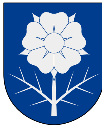
Erling Eidems heraldiske släktsvapen