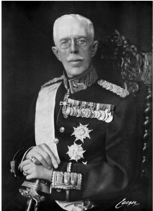
Kong Gustav 5, konge av Sverige 1907-1950

« Mein lieber Reichskanzler » skreiv svenskekongen Gustav 5 til Hitler høsten 1941. Allerede høsten 1940 ville svenskekongen, på oppdrag fra Göring - mekle mellom Churchill og Hitler. Men Winston Churchill aviste forsøket. Det offisielle Sverige hadde gjennom krigsårene et nært og godt forhold til Hitler-Tyskland. For som værhaner flest, holdt svenskene meget god kontroll med hvilken vei vinden blåste. En kilde til den kontakt som etablerte seg kan selvsagt ligge i at Gustav Adolf i 1932 giftet seg med prinsesse Sibylla, datter av storhertug Carl Eduard av Sachsen-Koburg. Bryllupet stod i Koburg, den første tyske byen som ble nazifisert. Sibylla ble senere mor til dagens svenskekonge, Carl XVI Gustaf.