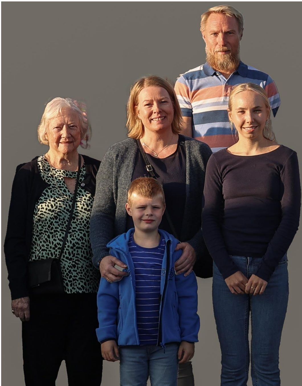
Familiemedlemmer med røtter fra Meråker