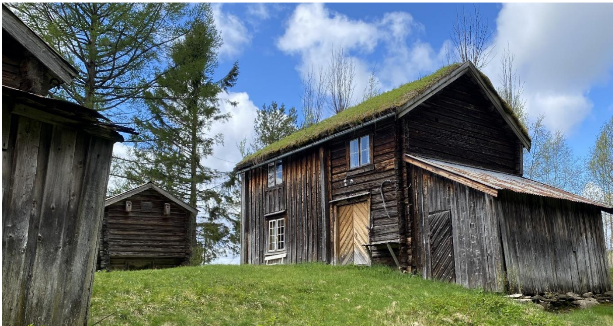
Kårråhaugen i Innbygda i Selbu en maidag 2025