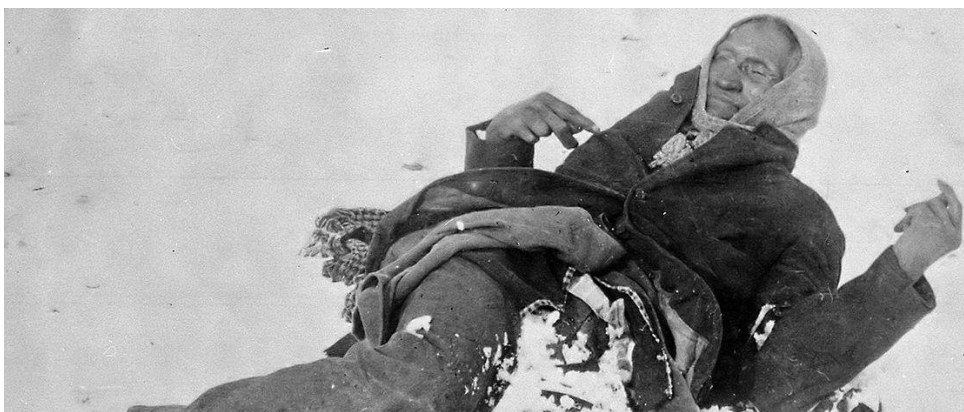
Det frosne liket av høvdingen Spotted Elk ved Wounded Knee

De såkalte «indianerkrigene» sluttet på et vis med massakren ved Wounded Knee den 29. desember 1890, hvor rundt 200 dakotaer ble drept av U.S. 7th Cavalry Regiment. Det heter seg at først tok de hvite bøffelen fra indianerne, så ble ulike stammer satt opp mot hverandre - og resten ordnet reservatene og alkoholen opp med. (Se for øvrig kapitlet 1862 Et inferno på prærien under linkene «Historier» og «Amerika og utvandring» på web'n: