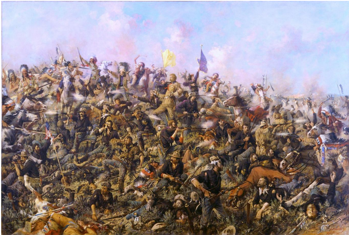
«Custer's Last Stand» 26. juni 1876 - illustrert av Edgar Samuel Paxson

Når du nå nettopp leste overskriften, er jeg ganske så sikker på at dine tanker gikk til Amerika og kampene mellom hvite nybyggere og indianerne, fremstilt gjennom Hollywoods mislykkede forsøk på å gjengi historien. Rett nok var det mange trefninger, men nesten alle var fredelige, basert på nysgjerrighet, utveksling og byttehandel. Flere ensomme pelsjegere og eventyrere vestover ble nok oftere tatt opp i stammen som inngiftet, enn drept. Men Custer sin skjebne ved Little Big Horn den 25. juni 1876 er nok det som fanger vår oppmerksomhet. Og alle filmer endte opp med at cowboyene alltid vant i kampen mot indianerne. Slik også