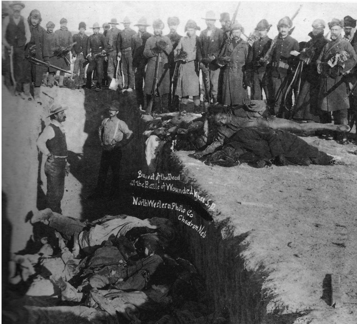
De stivfrosne likene av indianerne ble lempet ned i en fellesgrav

www.historiefortelleren.no ). Undertegnede har vært mange ganger ved «Custer's last stand» ved Little Big Horn, og det gir selvsagt inntrykk: ca. 242 soldater ble drept, og ca. 136 indianere. Men mine to besøk til Wounded Knee i Pine Ridge var kanskje sterkere. Det skal sies at tallene vedrørende relaterte drepte varierer sterkt ut i fra hvordan en «utvider slaget», samt senere vitneuttalelser fra indianerhøvdinger til amerikanske myndigheter.