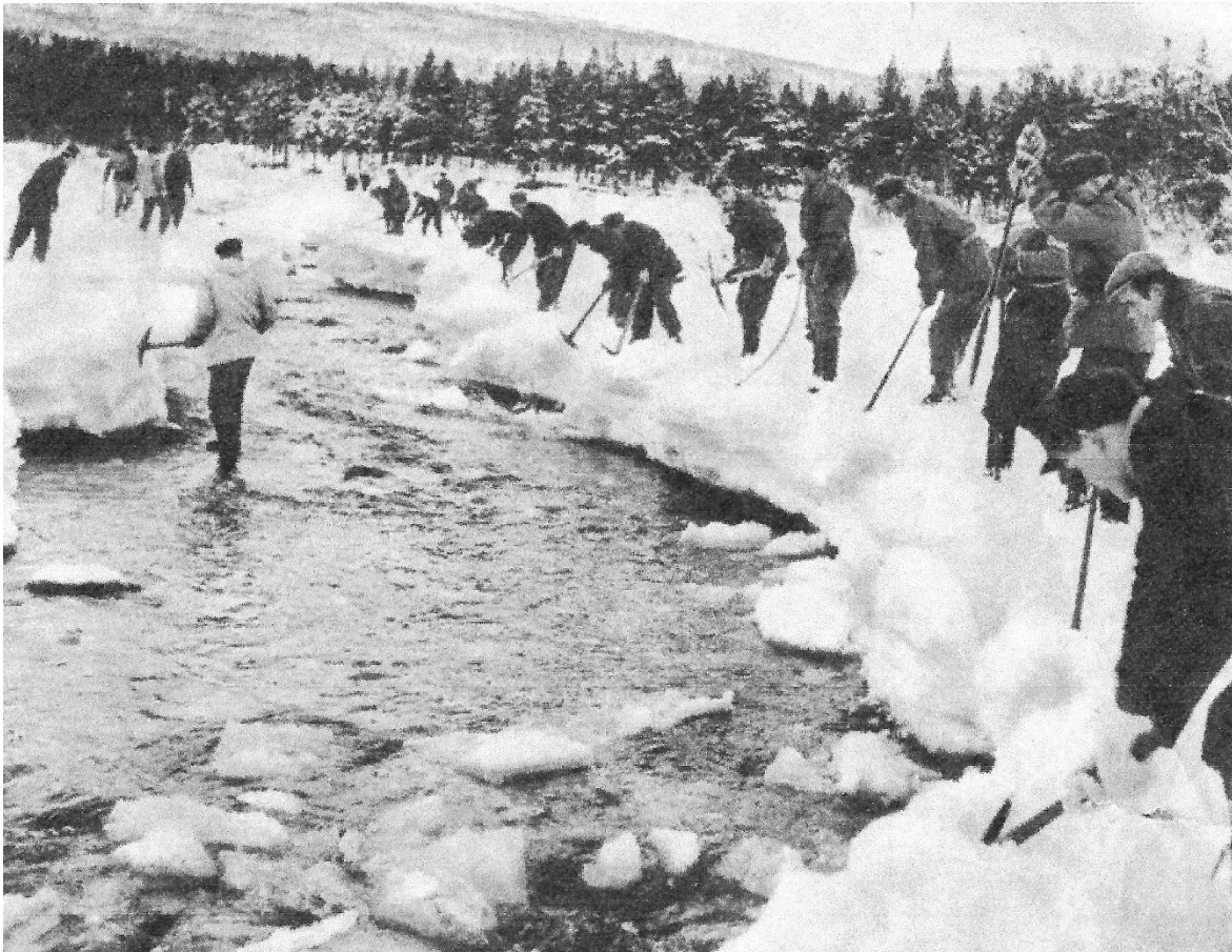
Den første mistanken gikk mot elva Rauma (faksimile fra NÅ, desember 1957,)