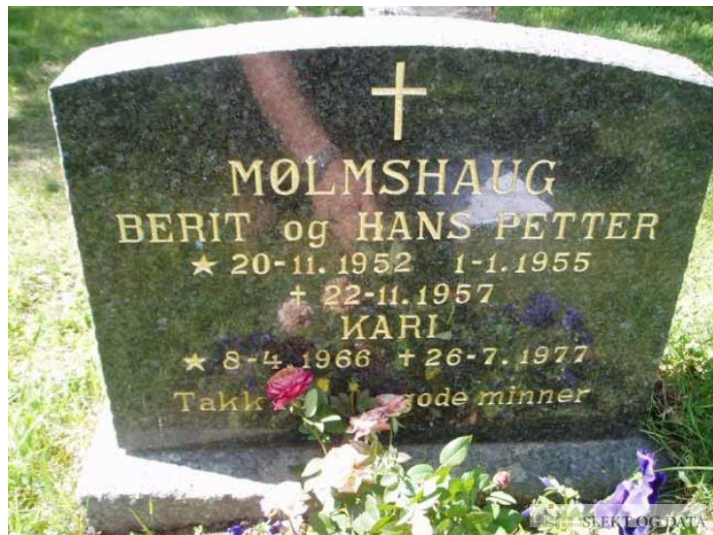
Ungene er nevnt på to gravsteiner

Hendelsen i 1957 satte dype merker i mitt barnesinn. Det har fulgt meg gjennom hele livet. Derfor dette anliggende og engasjement. Jeg har hatt kontakt med familien på Lesjaskog, og etter mange måneder med epost og brev, ble det en gedigen nedtur da familien ikke ville stille opp. Det må jeg godta og ha respekt for.