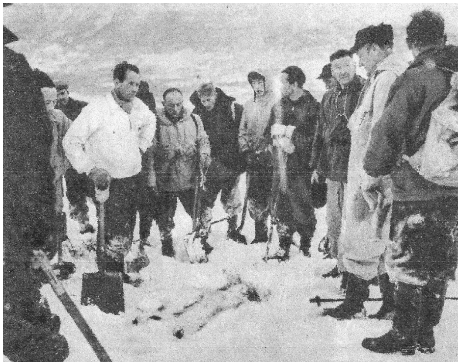
Funnstedet ((faksimile fra NÅ, desember 1957,)