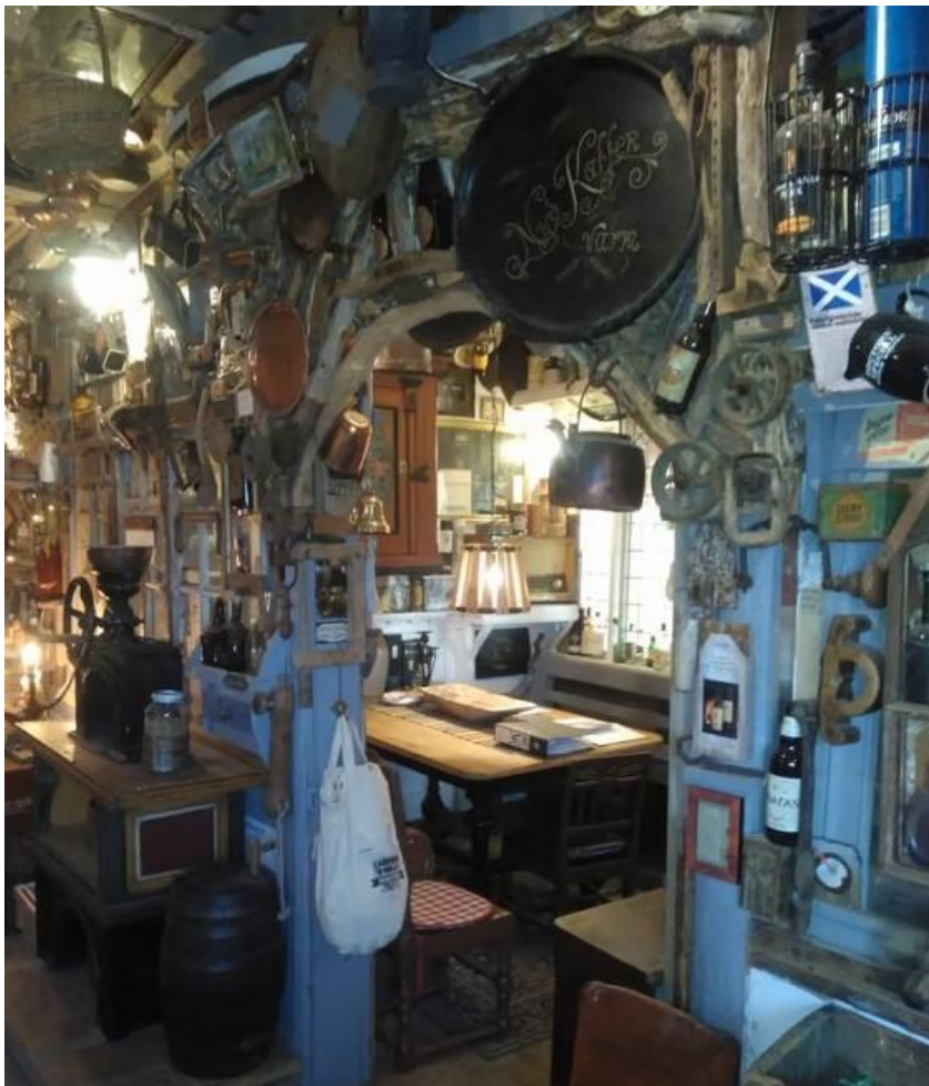
Flere rom i läven utgjør et museum, som inneholder gjenstander og rariteter