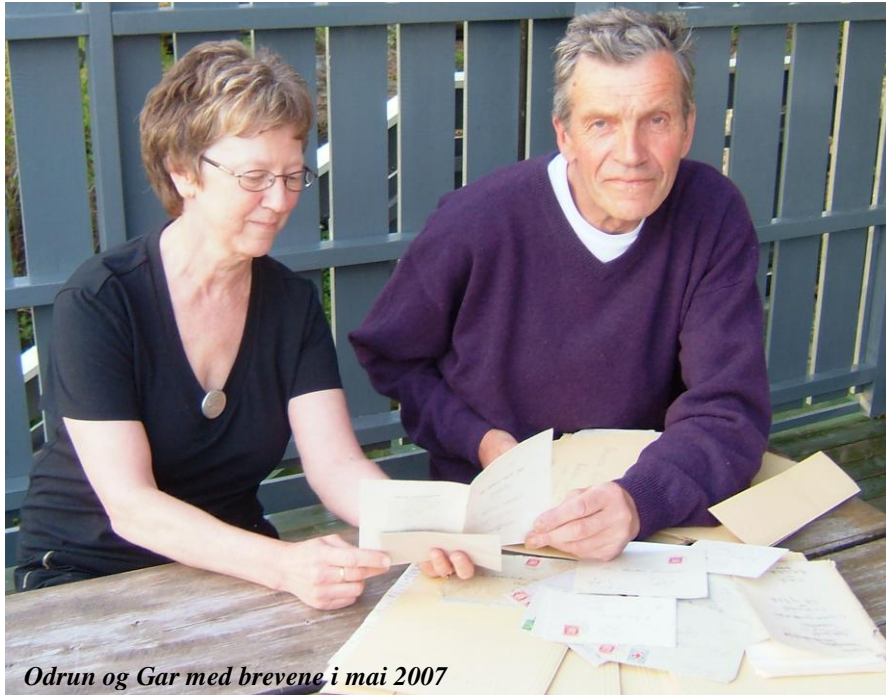
Odrun og Gar med brevene i mai 2007

ambisiøst, ble ikke stoffet alltid like godt gjennomarbeidet. I tillegg beveget han seg bort fra den rene skjønnlitteraturen med sitt stort anlagte kulturhistoriske verk Frå grensebygder og finnskogar , som fra starten av var planlagt i fem bind. Det rommer et til dels overveldende stoff, like mangfoldig som det kan virke tilfeldig sammensatt, men alltid båret av Garaasens entusiastiske iver etter å finne og formidle (kildesitater: fra Litteraturer av Geir Vestad).