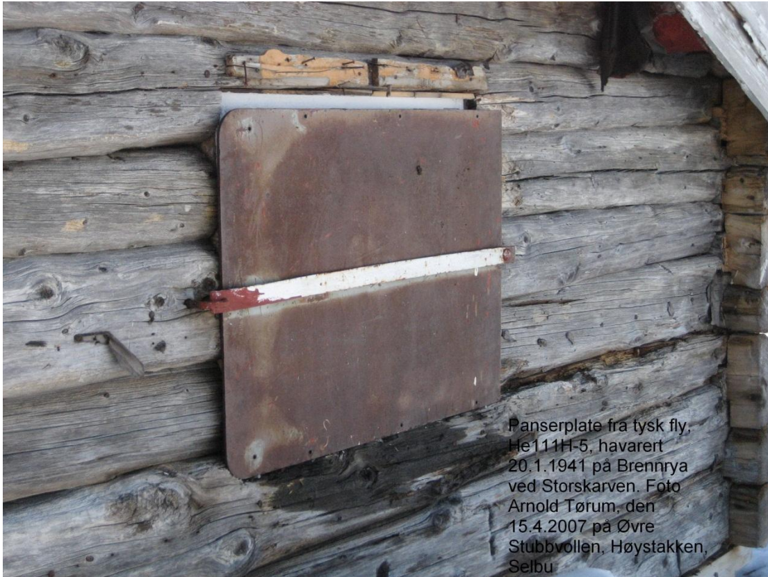
Panserplate fra tysk fly, He111H-5, havarett 20.1.1941 på Brennrya ved Storskarven. den 15.4.2007 på Øvre Stubbvollen, Høystakken, Selbu