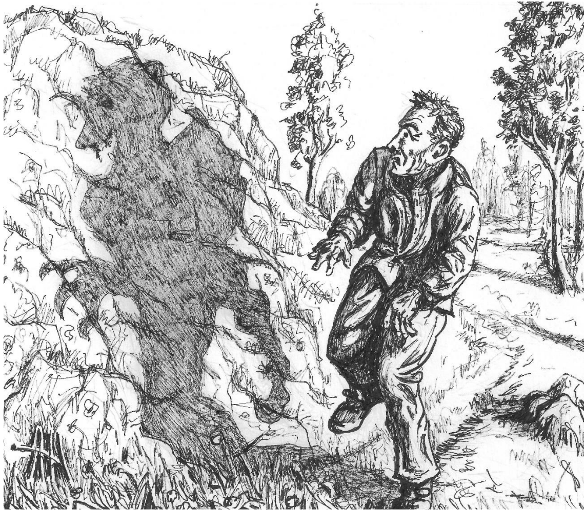
Av og til møtte han visstnok «styggjen sjøl»