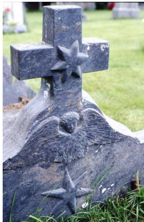
Barnegrav fra Hegra hogget ut av Annianias