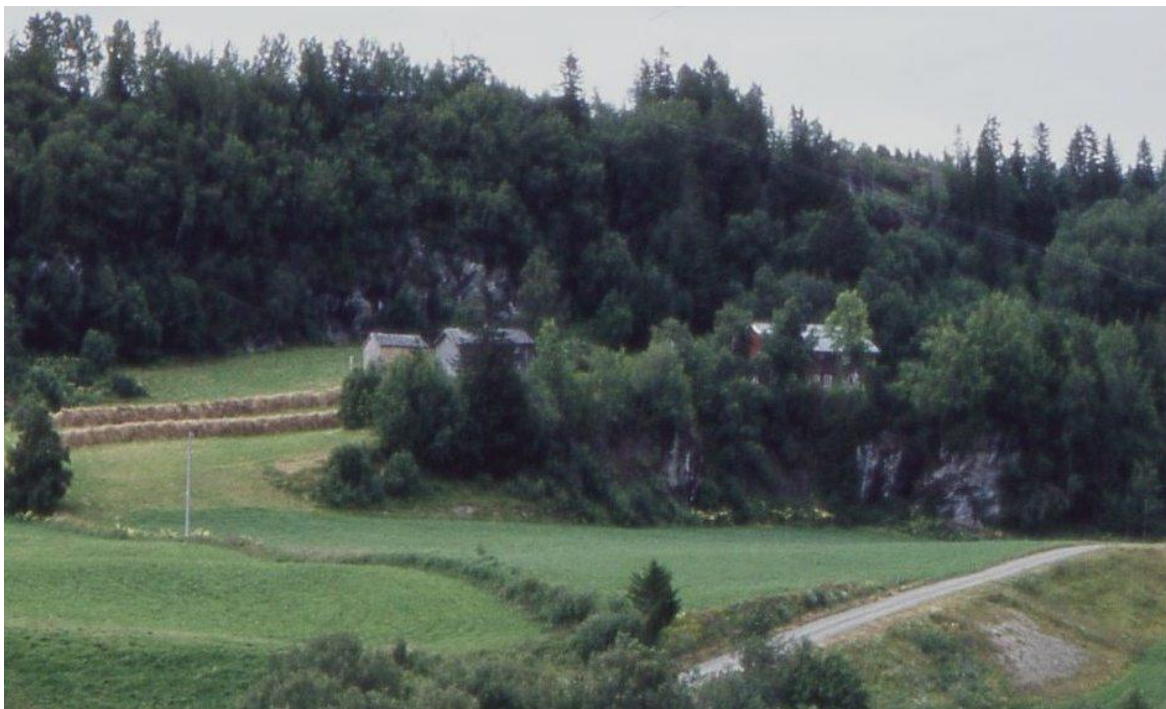
NN i Skjelstadmarka. Her lå huset til Annanias. Etter at han fikk koldbrann og døde, ble huset brent

Overtro og fantasi var bare en del av den mangfoldige kunstnerpersonligheten hans. Han kunne svinge fra lettivethet med fela i tredagers -bryllup til religiøse grublinger med bibellesning. Det fortelles at han som ganske ung spilte til dans på låven i et bryllup på Bulandet. Da det lei utpå kvelden kasta han fela på høystabben, sto opp på en skammel og