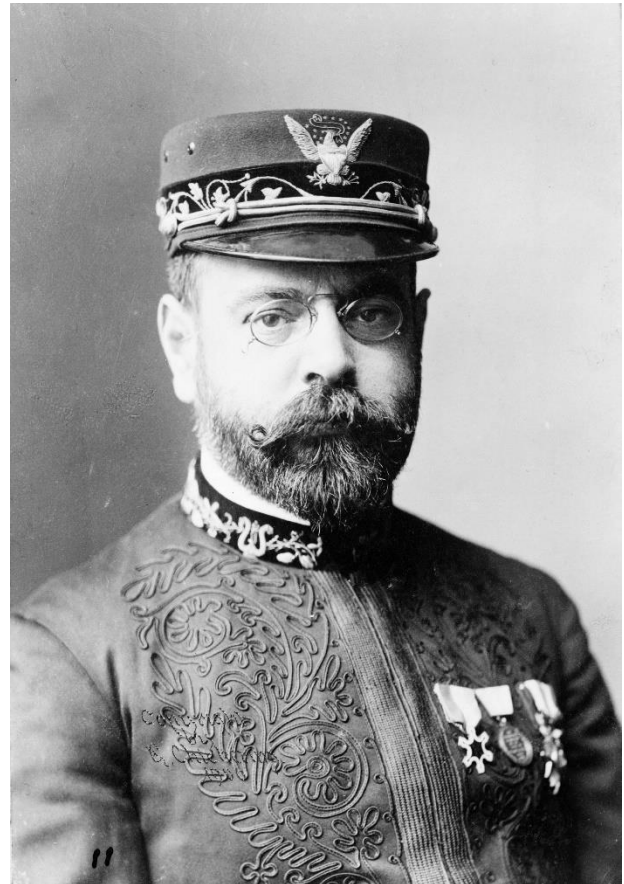
John Philip Sousa

Brigademusikken i Norge har lidd ulike skjebner. Dette skyldes en rekke nye «hærordninger» utover 1800-tallet, som igjen hadde sin bakgrunn i ulike stabssjefers behov for å markere seg gjennom egne organisasjonsplaner, og dels fordi militærmusikkorpsene tidligere var tillagt en taktisk-psykologisk effekt i militær teori. Nye kampformer og våpen gjorde musikkorpsene overflødige i en krigssituasjon. Etterhvert måtte alle musikere gå underoffiserskolen, og kom inn i lønnede forhold.