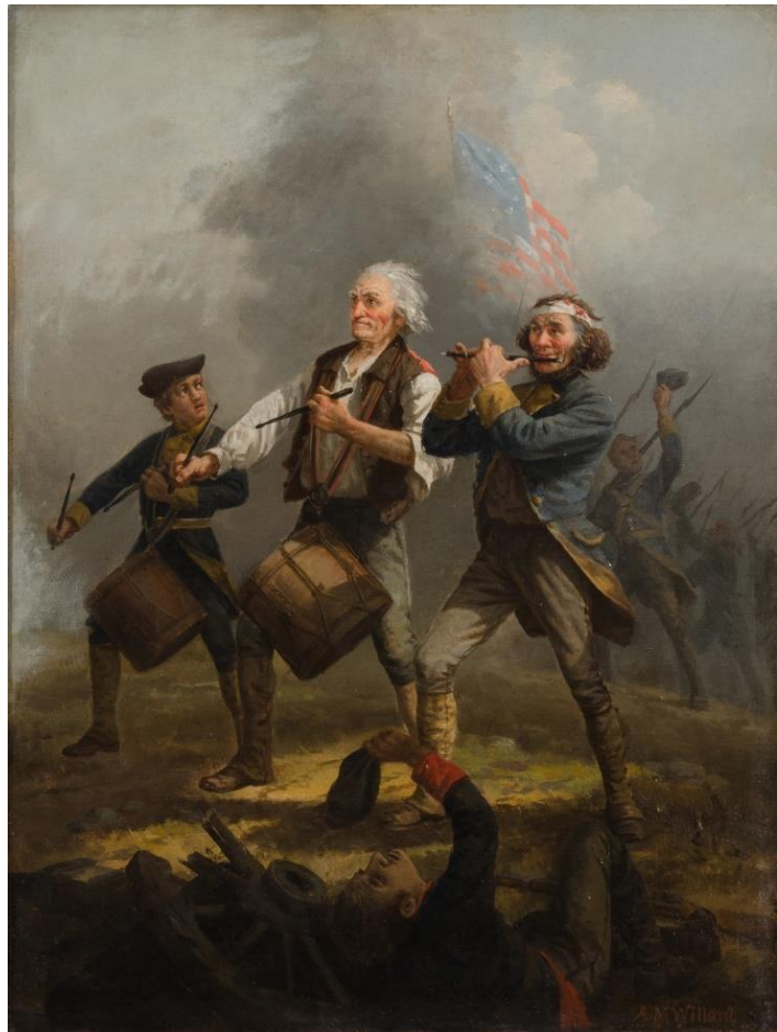
The spirit of 76 (Yankee Doodle), malt av Archibald Willard (1836-1918)

De ulike regimenter hadde sine egne musikk-korps, og fortsatt ble enkelte ordrer utført etter signaler fra kornettblåsere. Det som sitter mest igjen fra borgerkrigen hva angår militærmusikk, er trolig de patriotiske sanger og melodier som utviklet seg og oppildnet troppene, - spesielt deler av den såkalte Diximusikken.