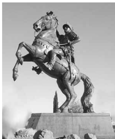
Fra venstre: Mt. Rushmore i Black Hills, Sør-Dakota og «The last Conquistador Don Juan de Qñate», El Paso Intern. flyplass, Texas