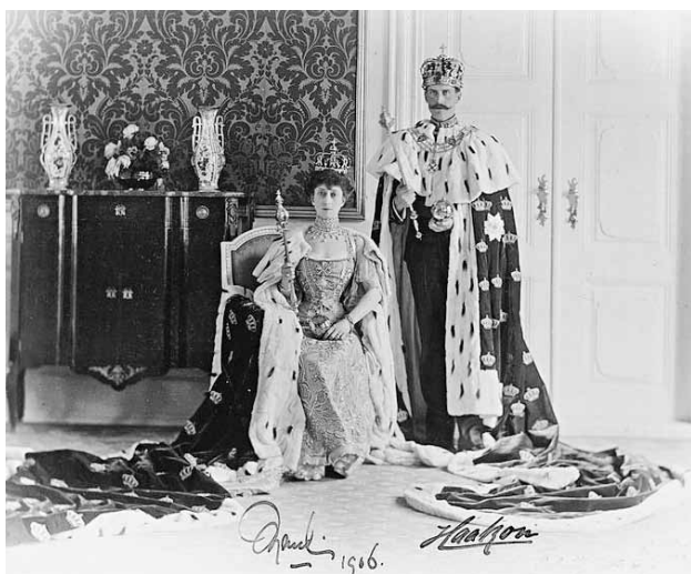
22. juni 1906. Det offisielle kroningsbildet

Da jeg gikk i barneskolen på 50-tallet, husker jeg hvordan blikket ofte festet seg på et spesielt bilde ute i gangen, likeledes nesten tilsvarende bilder inne i klasserommet. Det var bilder av daværende kong Haakon og dronning Maud. I 1957 ble de byttet ut med Olav og Märtha. I dagens overnøytraliserte samfunn er jeg ikke sikker på om det henger kongebilder på norske skoleinstitusjoner. Flere av de bildene som den gangen hang på skoler, og ellers på fremtredende plasser i samfunnet, sågar i mange private hjem, fant du naturligvis i skolebøkene. Faget Historie het Soge i min nynorskkommune, og skoleverket skiftet ikke ut lærebøker hvert år, for å si det forsiktig. Så for mange skoleelever som begynte på skolen etter 1957, var nok Haakon fortsatt konge i landet og muligens forble det gjennom hele barneskolen. Ett av de bildene som absolutt gikk igjen i historiebøkene, og som nok hang på norske skolevegger i mangfoldige tiår, er det offisielle kroningsbildet fra 1906, hvor kongeparet bærer sine regalier – kroner, septer, rikseple og kåpe. Et meget vakkert