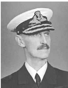
Kong Haakon VII

stolen under baldakinen iført kroningskappe og regalier. Etter kroningskantatens tredje del trådte dronningen fram. Dronning Maud ble salvet og