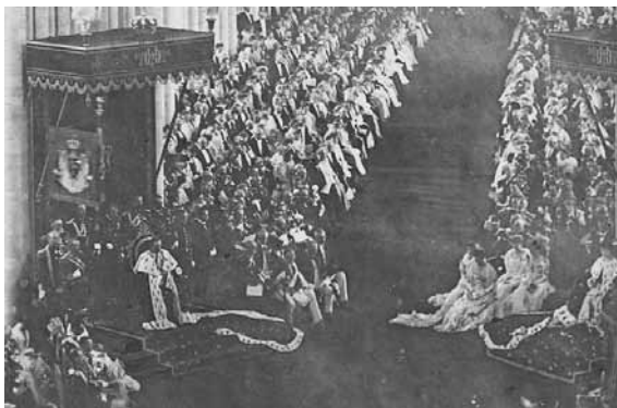
22. juni 1906

med kroning som gammeldags og lite demokratisk. Dermed ble seremonien ved kroningen av kong Haakon og dronning Maud tonet ned i forhold til tidligere kroninger. Blant annet ble den tradisjonelle kroningsprosesjonen fra Stiftsgården til Nidarosdomen sløyfet. Isteden dro kongeparet til domkirken i en kroningsvogn trukket av fire hester. I tråd med tradisjonen etter kong Carl Johan, ble kong Haakon kronet i uniform. Dronning Maud brøt imidlertid med tradisjonen ved å velge en kjole uten norske symboler. De to tidligere dronningene hadde vært iført kjoler prydet med den norske løve. På vei til kroningen reiste kong Haakon og dronning Maud med tog, hest og vogn, og skip. De hadde stanset mange steder under veis, for kroningsferden tjente også til å gjøre folket kjent med den nye kongefamilien og kongefamilien kjent med sitt nye folk og land. Turen tilbake til Kristiania foregikk med skip langs kysten. Kongefamilien forble i Trondheim flere uker, og forlot byen den 10. juli og nådde Kristiania 1. august. Reisen ble «fullført» året etter, med en lengre rundreise i Nord-Norge. Skikken med å gjøre en lengre reise til store deler av landet i forbindelse med en kroning eller signing, går tilbake til middelalderens konger som lot seg hylle på de ulike tingene rundt om i landet.