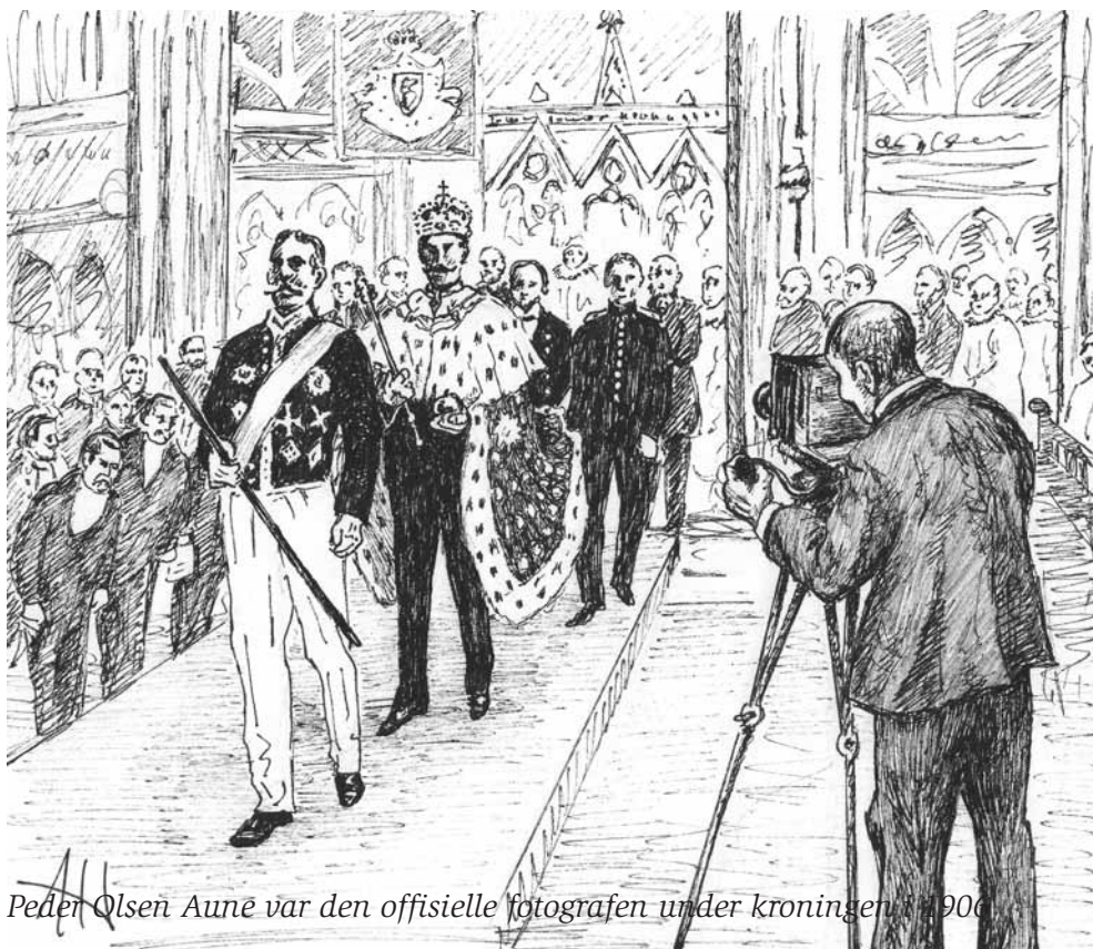
Peder Olsen Auné var den offisielle fotografen under kroningen i 1906