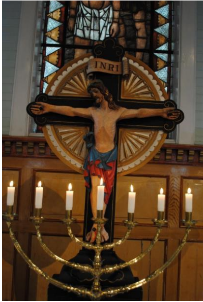
Dagens altertavle