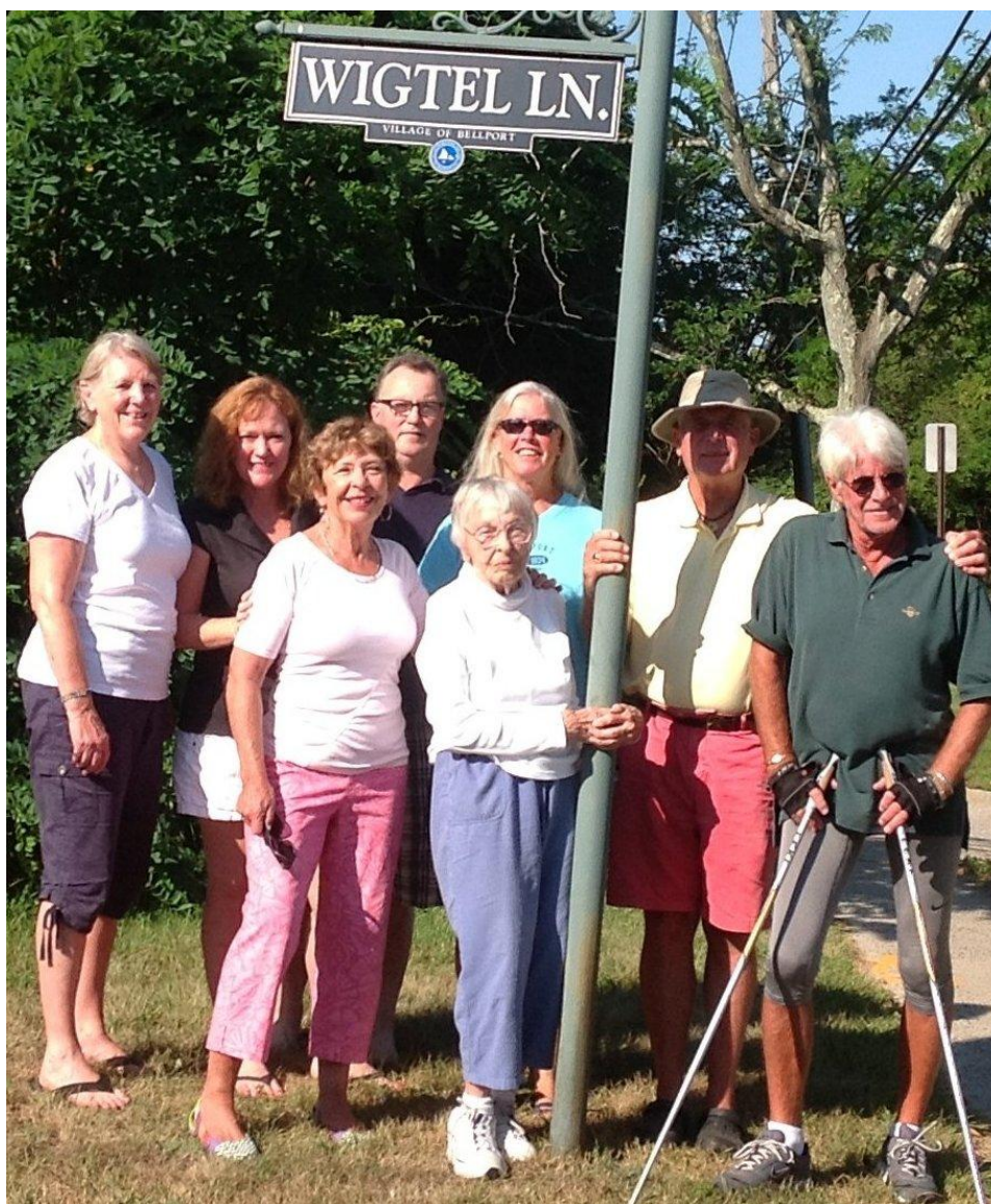
Noen av de som bor i Wigtel Lane, 1. august 2015