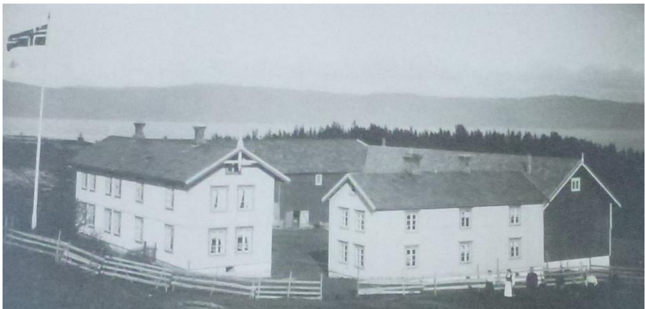
Vigtel øvre i gamle dager