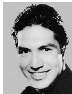
Ray Wise / Ray Mala