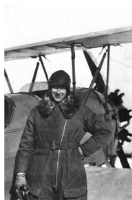
Russel Hyde Merrill