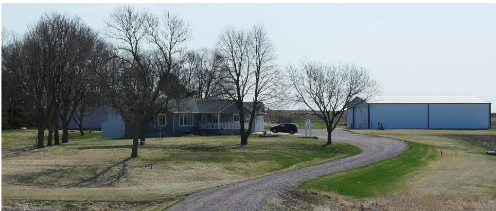
Rollag-farm 'n i dag