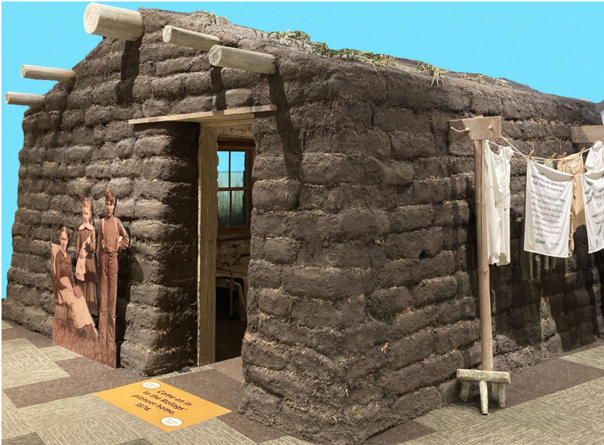
Familien Rollag sitt sodhouse på museum i Minneapolis