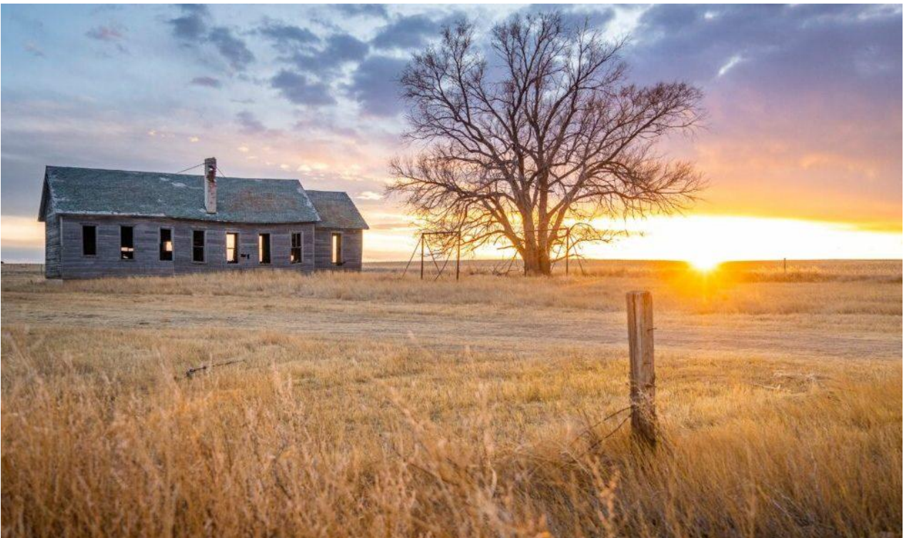
Omsider gikk også solen ned for de små skolene på prærien