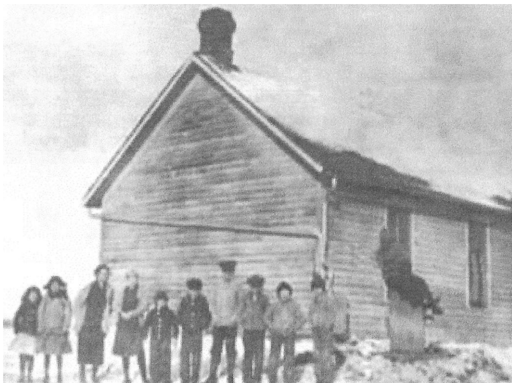
Den nye skolen stod ferdig i 1930