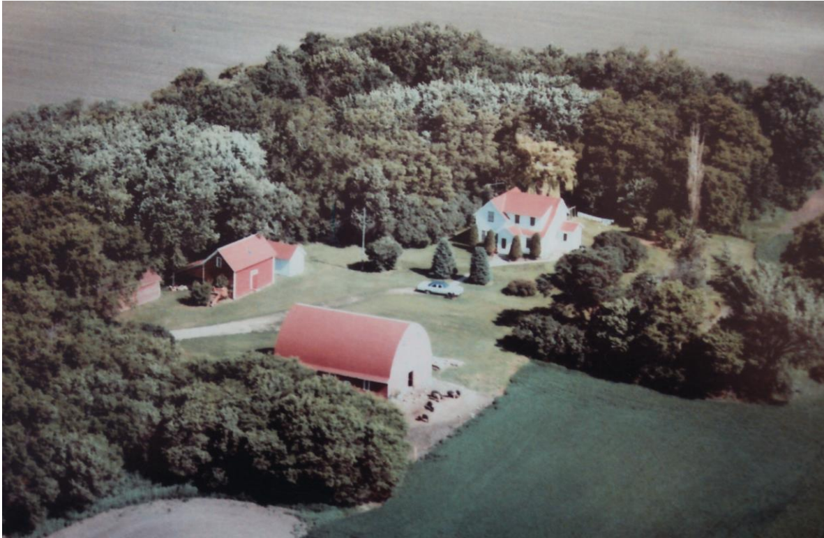
The Pine Grove Farm, som Klefsaasfarmen het den gangen, - i dag er den nedlagt og under forfall