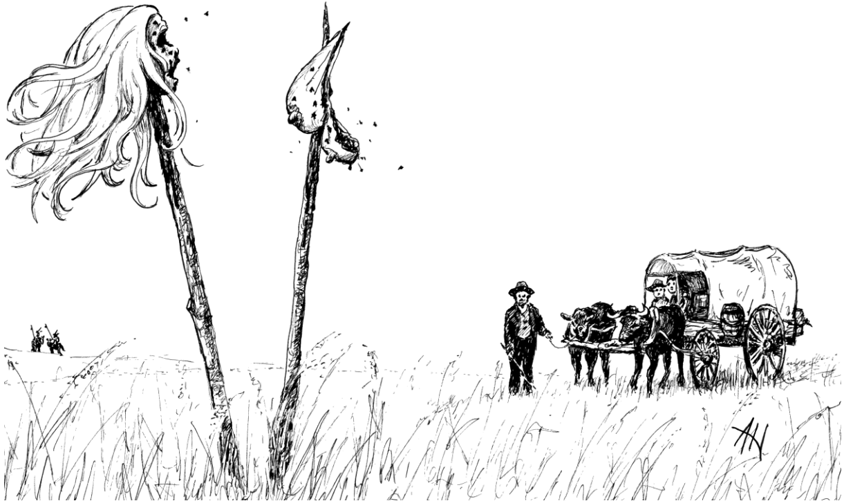
Et uhyggelig møte ute på prærien

ville ikke skremme ungene, men de visste at det var noen i nærheten, noen som fulgte med dem. Ville "de" angripe i grålysningen? Om morgenen - da lyset avslørte omgivelsene - så de hodet av ei kvinne satt på en stake. På en annen påle ved siden av hang hennes bryster. Det ble ingen frokost. Oksene ble pisket litt ekstra den morgenen.