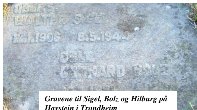
Gravene til Sigel, Bolz og Hilburg på Havstein i Trondheim

I og for seg et menneskelig trekk hos de som kontrollerer andre.