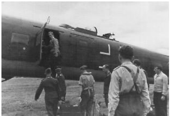
Fra Værnes.

Da de allierte satte inn fire større angrep mot Tirpitz i Fættensfjorden våren 1942 (se Stjørdalens krønike , bind 3, side 108), ble også enkelte spredte sekundærangrep utført mot selve flyplassen på Værnes. To Condorer ble skadet. Flere Condorfly skar ut i avgangsfasen fra Værnes. Den første ulykken skjedde 25. mai. Condoren totalhavarerte og brann opp. To av de seks om bord omkom (Löhmman og Seifert), to ble skadet (Kerber og Klütgens) og en savnet (Voss). Den siste uken i august og første to ukene av september var det fire mindre