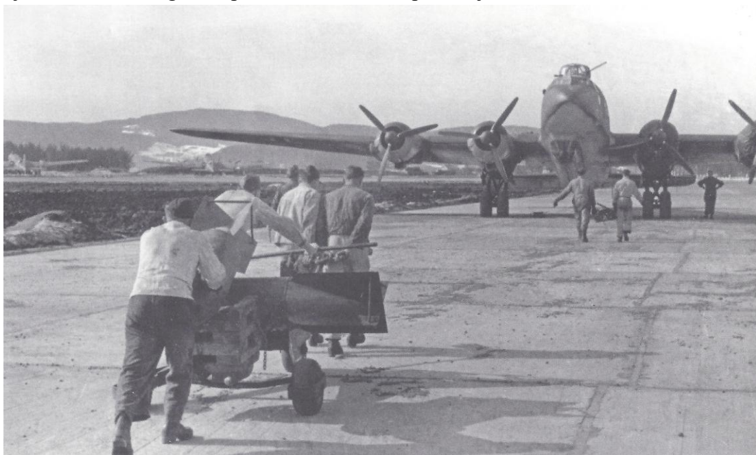
KG 40's våpenfolk triller bomber på Værnes i april 1942.

Det neste prosjektet Condor-flyene støttet, var værstasjonen HOLZAUGE til Nordøst-Grønland, og fra 10. juli til 24. august fløy I/KG 40 fem tokt isrekognosering fra Værnes for ekspedisjonen. 25. mai 1943 ble HOLZAUGE bombet av amerikanerne, faktisk ledet av Bernt Balchen, og dagen etter slapp Condor F8+IL 10 containere med forsyninger til mannskapet. Mannskapet ble evakuert med en Dornier Do 26 til Norge 7. juli.