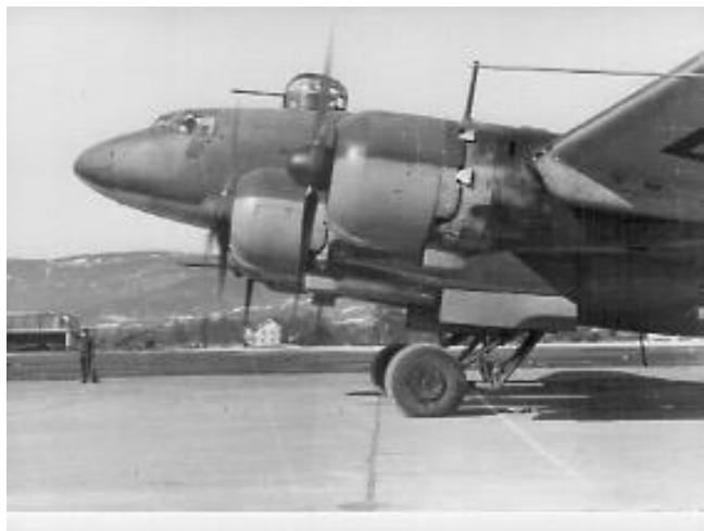
Fra Værnes.

Vinteren 40-41 var Condorene fryktet. Churchill kalt dem " Atlantens skrekk ". Hva gjelder Norge ble Sola viktig våren 1941 i forbindelse med slagskipet Bismarck, og i slutten av april ble Gardermoen klargjort for nattoperasjoner. Condorenes lange rekkevidde ble bindeledd med ubåtene som dermed ble dirigerte mot de ulike konvoiene og målene. Bismarck ble for øvrig senket av Royal Navy 27. mai 1941. De nærmeste dager etterpå ble flere Condorer satt inn i søks- og redningsarbeidet etter overlevende. Samtidig begynte "Fliegerführer Atlantik" en større aktivitet mot konvoier til og fra Gibraltar, siden det tyske Afrikakorpset fikk uventet motstand. De Condorene som lå i Norge ble trukket sørover, og det skulle gå mange måneder før tyskerne igjen valgte å utplassere disse langdistanseflyene i Norge.