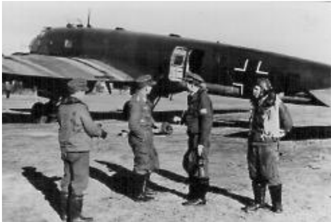
Fra Værnes.

1944. To slike slipp i februar ble avblåst, mens et slipp av post 14. mars var vellykket. Tirsdag 2. mai tok Condor F8+NL igjen av fra Banak for å etterforsyne værstasjonen SVARTISEN på Hopen. Ti dager senere måtte Stahnke bruke en C-4, F8+ UL, da han fra Banak slapp forsyninger til KREUZRITTER i Liefdefjorden, nord på Svalbard. På tilbaketuren beskjøt han den norske utposten på Kap Heer med maskingevær. Det ble det siste tyske flyangrepet på Svalbard.