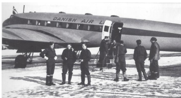
Rutefly med Condor. OY-DEM på Gardermoen 25. april 1946.

Ålborg-Göteborg-Oslo. 10. mai 1946 ble dagen for den aller siste Condorflygingen i Norge. Condor fløy litt etter dette også andre steder i verden: tre i Sovjet, ett i Spania og to i Brasil,