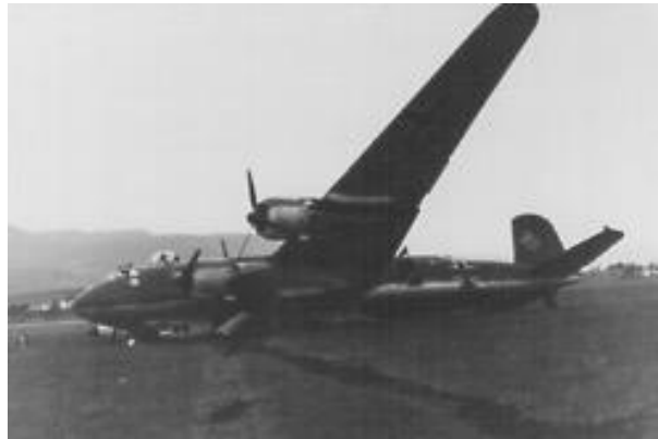
Fra Værnes.

Tapene fortsatte da Oberleutnant Ernst Rebensburg og seks mann i Condor F8+CL forsvant over Norskehavet 17. januar 1944. Også andre farer truet, fra nyttår hadde Murmansk-konvoiene fått eskortehangarskip med jagerfly. Konvoi JW 58 seilte 27. mars fra Loch Ewe i Skottland, og med tre skip fra Island, seilte i alt 50 handelsskip med en kraftig eskorte, inklusive hangarskipene HMS "Activity" og "Tracker" med kurs for Kolafjorden. Etter at en Junkers 88 var skutt ned 30. mars, seilte konvoien dagen etter nordøstover, øst for Jan Mayen, da to Grumman