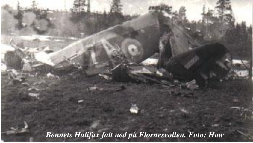
Bennets Halifax falt ned på Flornesvollen.

Meningen var å gå rundt å gjøre et nytt forsøk, men da blir de truffet og får en skade på en motor på høyre siden. Valget ble å forsøke å nå Sverige. Men etter et par minutter gjenvant de såpass kontroll over flymaskinen at de valgte å sette kursen vestover og hjem til Skottland. Ut mot Fosen oppstod det brann i motoren. Det medførte en