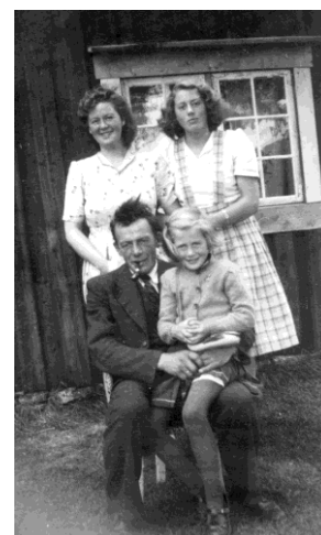
Marta og Eli Peter og Sigrund

Et tysk fly takser på fjorden forbi Nygård i Hommelvik, i retning Svarneset. Det blåste en del fra sørøst, og piloten hadde bestemt seg for å ta fart fra ganske langt innenfor Svartneset, oppunder Solbakken. Vinden og dermed bølgene var for store ute på selve fjorden. Piloten planla derfor å ta av mot Hommelvik stasjon, svinge venstre og oppnå tilstrekkelig løft og høyde over Karlslyst slik at han raskt kunne komme seg på vestlig kurs ut av bukta. Dette hadde han gjort før. Kurven kunne bli i skarpest laget. En viss fare for stalling var alltid til stede, men han visste at dersom en slik indikasjon kom, kunne han forsinke svingen ved å fly mot Hågenstad hvor sørøsten raskt ville presse ham opp over det kritiske terrenget som hadde en høyde på 800 ft (247 m). Riktignok var flyet ganske så tungt, på ingen måte fullastet, men han måtte nok innrømme at det var temmelig så godt lastet med grønnsaker. Han følte han hadde et viktig oppdrag å utføre.