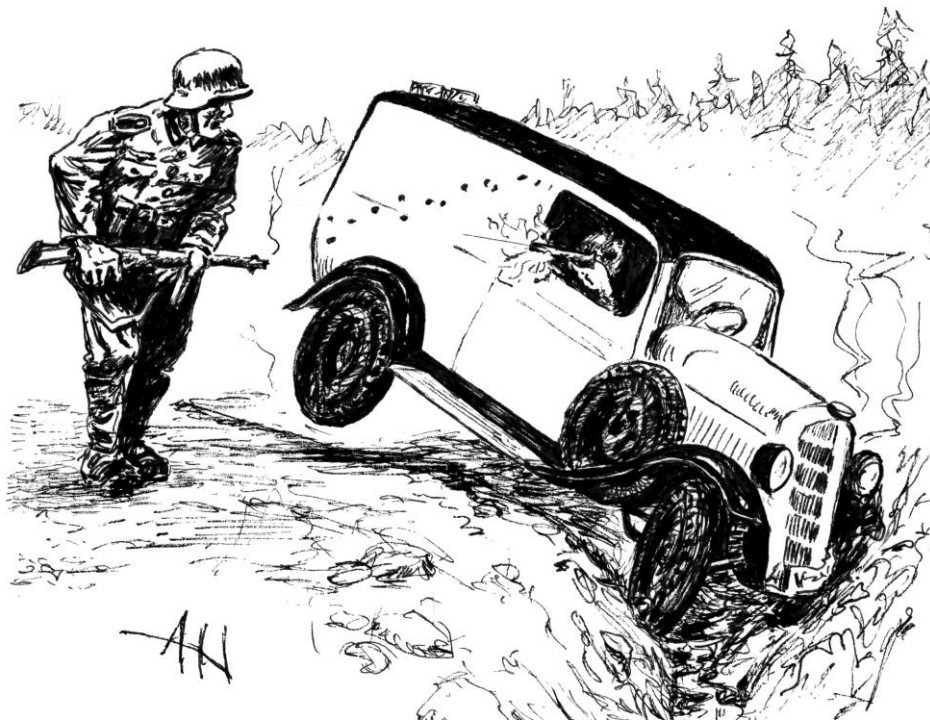
Hendelsen som førte frem til "slaget ved Garberg bro"

Her har tallene på drepte variert svært mye hva gjelder okkupanten. Det begynte på 260 døde. Siden har tallene falt. Selv seriøse forfattere og lokalhistorikere har operert med altfor høye tall, flere har ligget omkring 20 - 30 de siste årene. Noen har skrevet at 37 døde tyskere ble funnet i skogen bak Hegra festning påfølgende sommer. Dette må være vill fantasi. Og tallene bør totalt sett tones ned. Jeg kan ikke finne flere enn tre drepte blant okkupanten, og det var østerrikere. Seks nordmenn omkom under det vi kan kalle "slaget om Hegra festning". Det var ingen okkupanter på Stjørdal den 9. april, slik også noen skriver, bare for å ha nevnt en misvisning til i vår opplæring. Og blant de som deltok ved Hegra (15. april - 5. mai), var det knapt tyskere, men østerrikere, hvilket er viktig overfor fantastene som hevder at okkupanten brent likene, når jeg spør hvor "alle drepte" ble av. Okkupanten hadde våren 1940 meget sikker kontroll på hver eneste mann i sin tropp, og de som ble drept undergikk dokumentere seremonier. "Likbrenning" er noe vi forbinder med de store slag på østfronten grunnet sykdomsproblematikk. Under "slaget om Hegra festning" var det altså østerrikere som deltok. De er katolikker og katolikker på den tiden brente ikke sine døde.